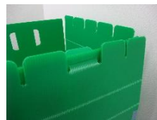
開きドアを簡単に差込固定する