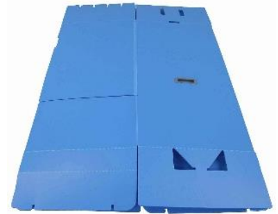
簡単に折畳みができる