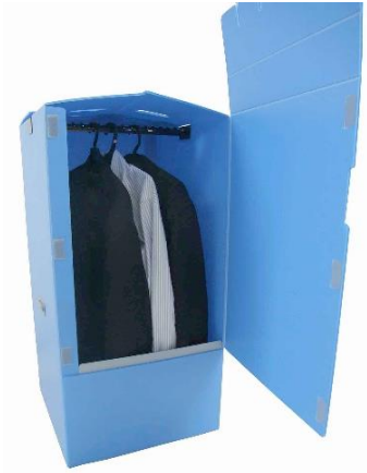
横に開くから場所をとらない