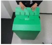
上部の蓋は差込むだけです