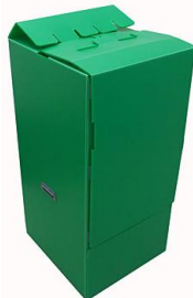
底部の組立は差込むだけ